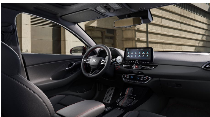
Černý interiér N line Premium – prémiové čalounění v kombinaci kůže/semiš – černé čalounění stropu a obložení bočních sloupků – červeně prošívání sportovní volant, hlavice řadící páky a loketní opěrka