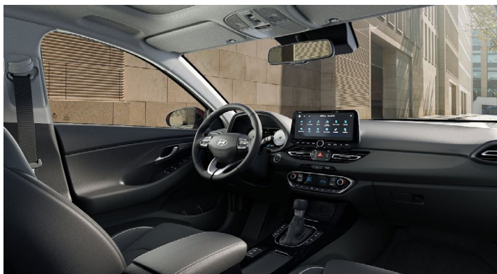
Černý interiér Oceanic Black – látkové čalounění sedadel – světlé čalounění stropu a obložení bočních sloupků – černé provedení přístrojové desky a výplní dveří