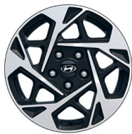
16" kola z lehké slitiny