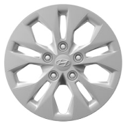
15" ocelová kola s celoplošnými kryty