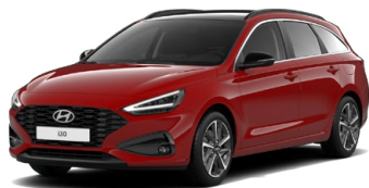
Engine Red Pastelová Cena: 0 Kč