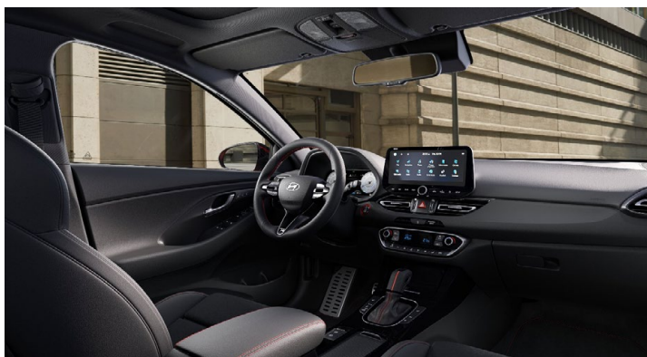
Černý interiér N line – látkové čalounění s červeným prošíváním a logem N – černé čalounění stropu a obložení bočních sloupků – červeně prošívání sportovní volant, hlavice řadící páky a loketní opěrka